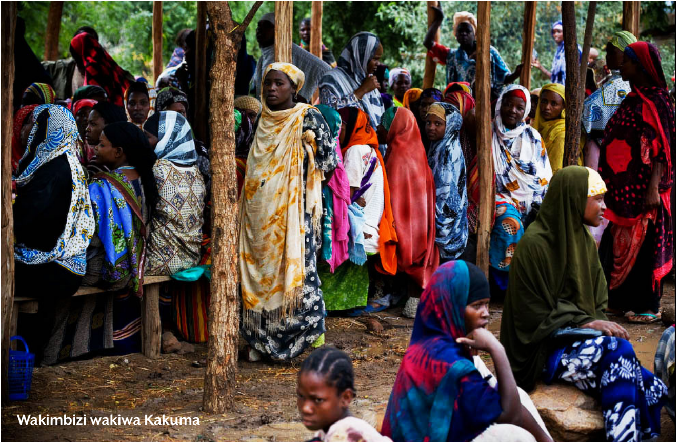
Wakimbizi wakiwa Kakuma